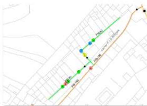
Esquema d'avaries actuació 09

Es proposa la renovació d'aquest tram de xarxa amb canonada de fosa dúctil de 80 mm de diàmetre nominal, així com tots els elements necessaris pel correcte muntatge de la canonada. Es preveu la instal·lació de quatre vàlvules de seccionament. Aquest tram de xarxa continuarà sense mallar, per la qual cosa s'instal·larà un tap a l'alçada del n°6, així com una vàlvula de ventosa per tal d'eliminar les possibles bosses d'aire que es puguin generar en el punt alt de la xarxa i millorar així el seu funcionament. El projecte també preveu la instal·lació d'una vàlvula de descàrrega a l'alçada del n°44 que permetrà purgar la nova canonada.