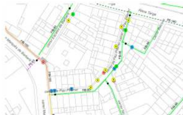
Esquema d'avaries actuació 04

D'acord amb la Instrucció tècnica complementària SP 120/2010 sobre el Sistema Hidrants d'incendi per a ús exclusiu de bombers es projecta la instal·lació de dos hidrants nous soterrats ubicats al carrer Riera Targa i al carrer Marquès de Barberà.