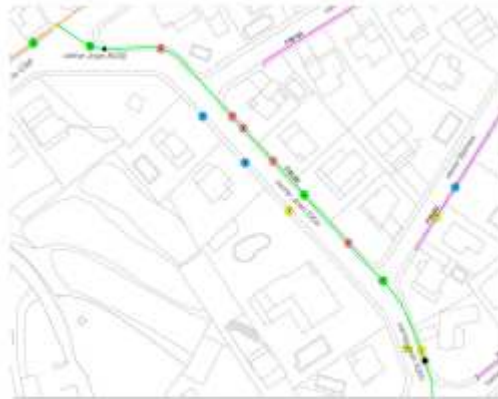
Esquema d'avaries actuació 07

Pressupost: El cost de l'actuació 7 té un valor de 30.117,77 €