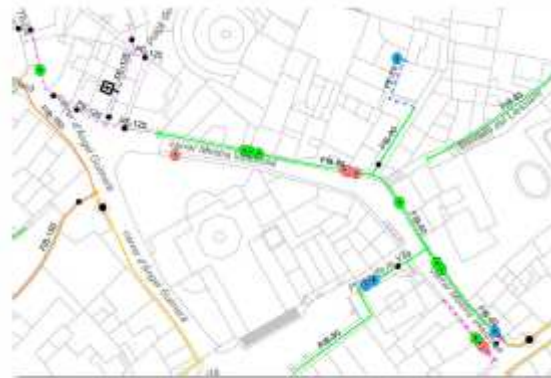
Esquema d'avaries actuació 03

Es proposa la renovació de la xarxa, a l'àmbit d'actuació, amb canonada de fosa dúctil de 80 mm de diàmetre nominal, així com tots els elements necessaris pel correcte muntatge de la canonada. El ramal que dona subministrament als habitatges dels n°20 al n°32, serà substituït per canonada de polietilè de 90 mm de diàmetre nominal. Es preveu la instal·lació de quatre noves vàlvules de seccionament. El projecte també preveu la instal·lació d'una vàlvula de ventosa per tal d'eliminar les possibles bosses d'aire que es puguin generar en el punt alt de la xarxa i millorar així el seu funcionament, així com la instal·lació d'una vàlvula de descàrrega que permetrà purgar la nova canonada.