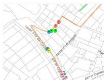
Esquema d'avaries actuació 10

Es proposa la renovació d'aquest tram de xarxa amb canonada de fosa dúctil de 150 mm de diàmetre nominal, així com tots els elements necessaris pel correcte muntatge de la canonada. Es preveu la instal·lació d'una vàlvula de seccionament. Aquest tram de xarxa quedarà mallat, a través de dos connexions a la xarxa existent.