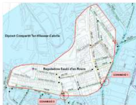
Sector Sauló d'en Roure

Donat el gran nombre d'avaries que es produeixen al sector, es proposa la instal·lació d'una vàlvula reguladora de pressió amb l'objectiu de modificar els pisos de pressió actual. Aquesta vàlvula quedarà ubicada al carrer Sauló d'en Roure, poc abans de la cruïlla amb el carrer Torrent de la Galvanya. Així mateix, es preveu la instal·lació de vàlvules tancades als altres dos punts que donen subministrament al sector, un al carrer Balears i l'altre al carrer Torrent d'en Daniel.