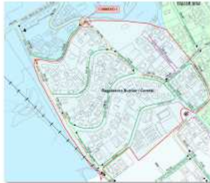
Sector Burriac / Comtal

Pressupost: El cost de l'actuació 1 té un valor de ___ €