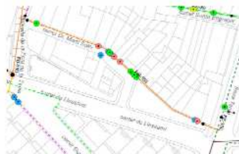
Esquema d'avaries actuació 08

D'acord amb la Instrucció tècnica complementària SP 120/2010 sobre el Sistema Hidrants d'incendi per a ús exclusiu de bombers es projecta la instal·lació de dos hidrants nous soterrats ubicats al carrer Riera Targa i al carrer Baixada de la Font de la Teula.