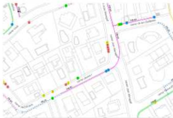
Esquema d'avaries actuació 05

D'acord amb la Instrucció tècnica complementària SP 120/2010 sobre el Sistema Hidrants d'incendi per a ús exclusiu de bombers es projecta la instal·lació d'un hidrant nou soterrat ubicat a la cruïlla entre el carrer Joan Maragall i el carrer Guillerries.